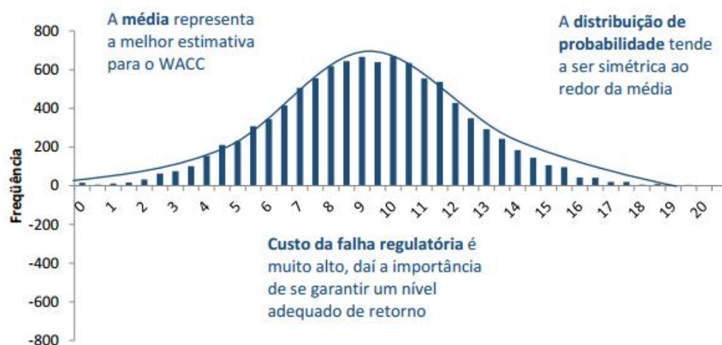
Gráfico 2: Abordagem Probabilística para o WACC

flutuação ao longo do tempo. Assim, a metodologia empregada nos garante que o WACC calculado é tão somente uma estimativa do WACC real, e que para um determinado nível de significância escolhido, há em torno do WACC calculado um intervalo simétrico no qual provavelmente se encontra o WACC real.